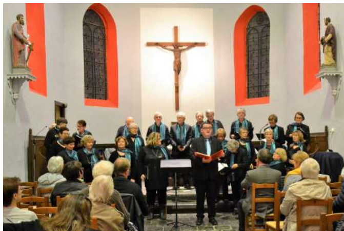
photo du cantus église de wannehain.

Ils vous donnent rendez-vous à Bouvines pour le traditionnel concert de Noël.