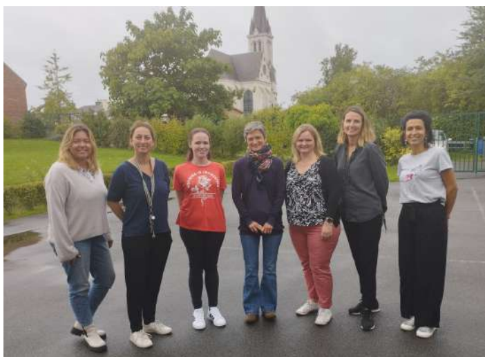
Nous leur souhaitons une très bonne année scolaire.

L'équipe enseignante pour l'année 2023/2024 est la suivante (de gauche à droite sur la photo) :